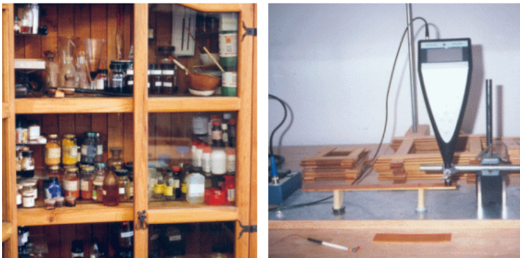
Abb.: Lackschrank mit Einzelsubstanzen und Messung lackierter Probestreifen im Meisteratelier für Geigenbau Martin Schleske

b) eine möglichst große Zunahme des Verhältnisses von Schallgeschwindigkeit zu Dichte. Dies hat eine Erhöhung der musikalischen Modulierbarkeit des Instrumentes zur Folge (zur Begründung dieser These: „Vibrato“)